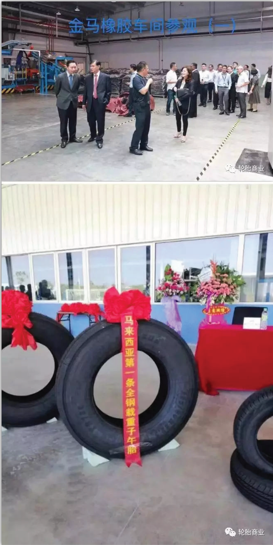
2016年9月28日，青岛福临轮胎有限公司签署了海外第一个生产设施，该工厂将在马来西亚建成，当时预计将于2017年5月进入运行。